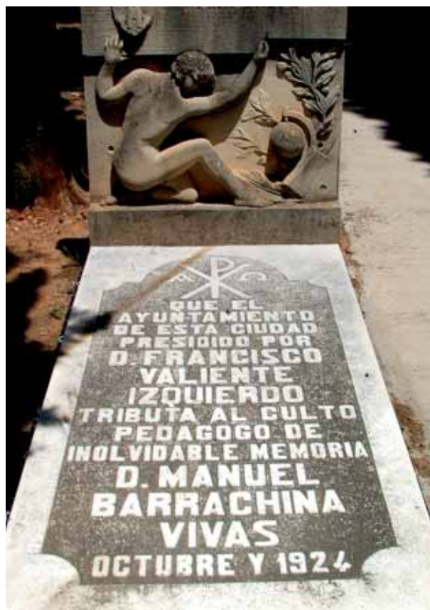
Mausoleu del Mestre al cementiri de Tavernes.