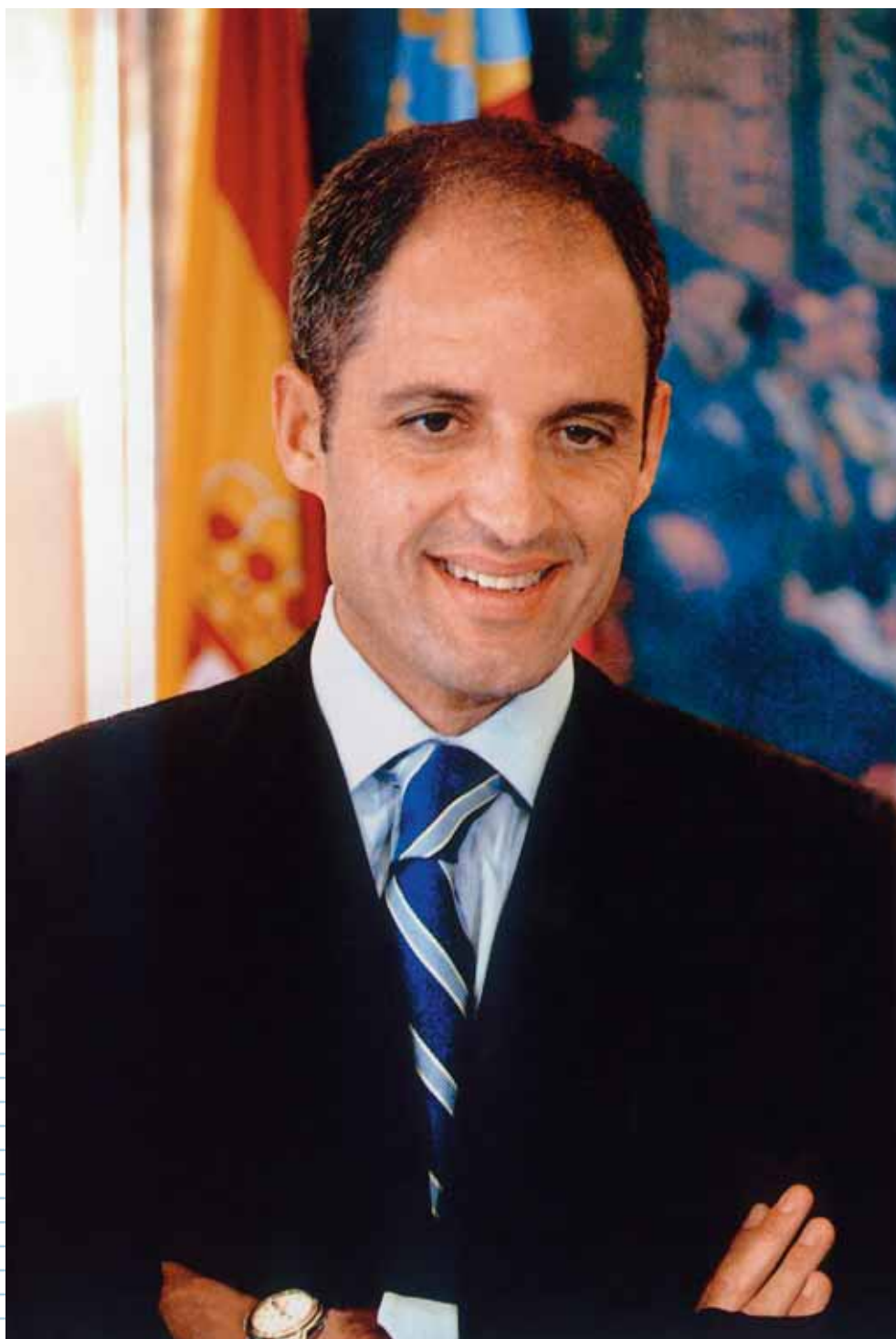
Francesc Camps Ortiz Molt Honorable Sr. President de la Generalitat Valenciana